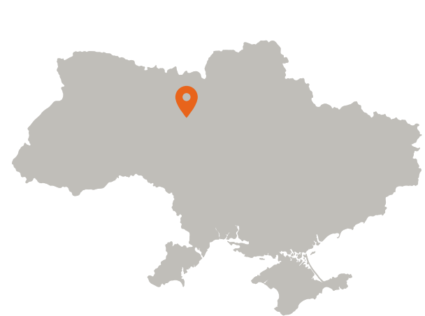
1 filiale in Ucraina