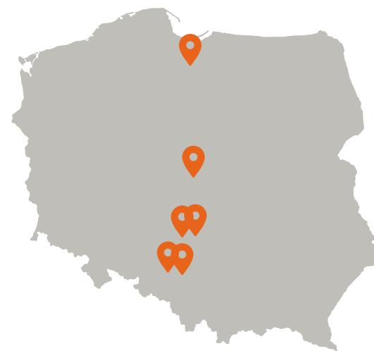
6 filiali in Polonia