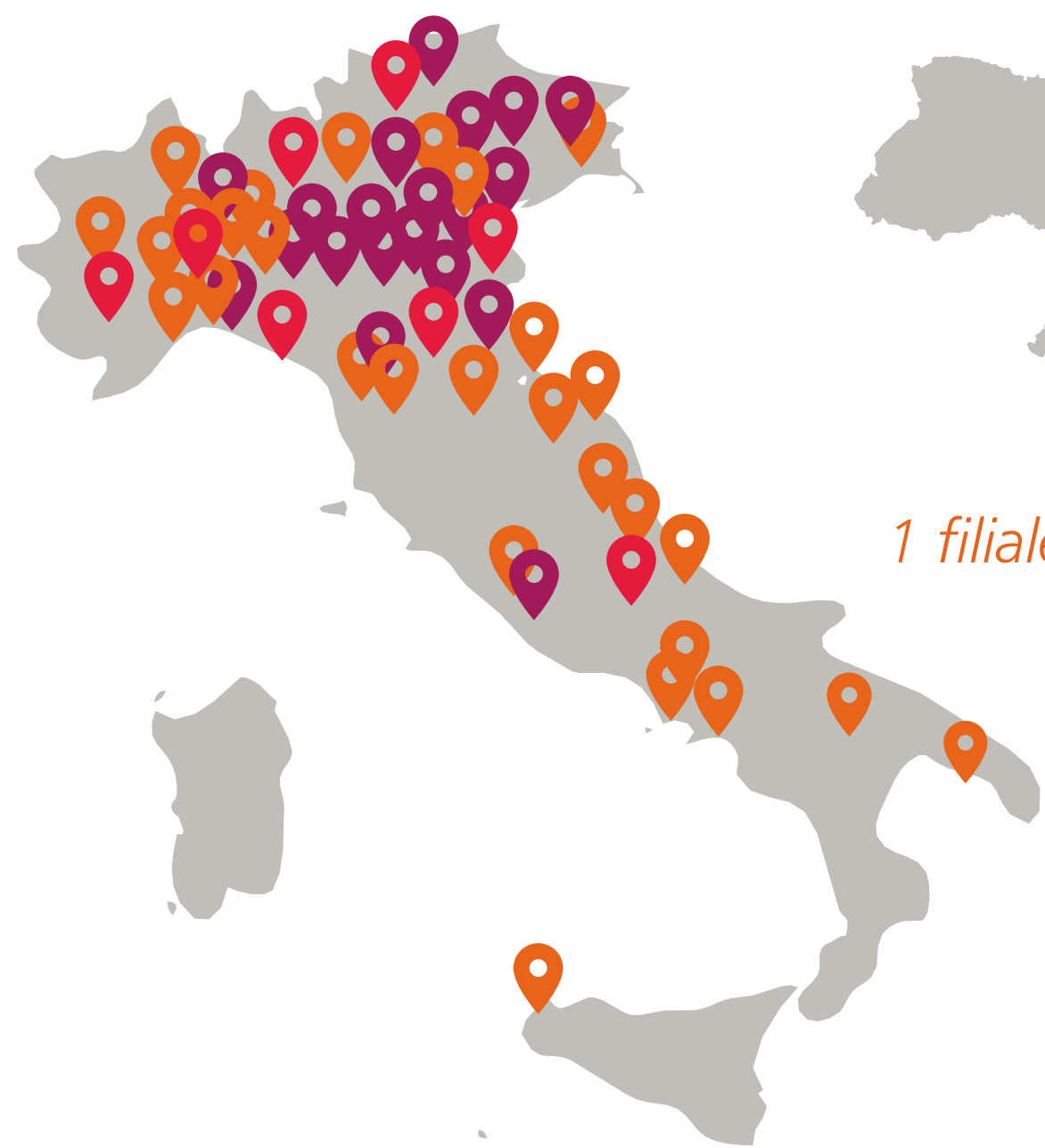
+90 filiali in Italia