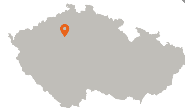
1 filiale in Rep. Ceca