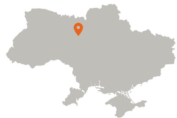
1 filiale in Ucraina